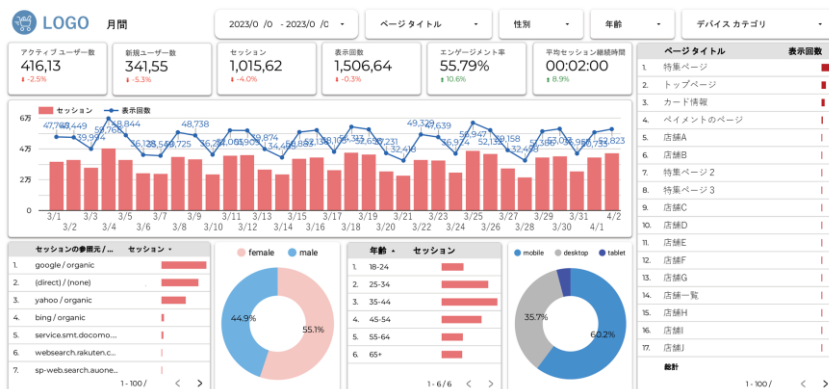
※ダッシュボードのイメージ

企業のホームページデータのマーケティング活用されるなかで、多くの企業で導入されているGoogle Analytics 4 (GA4) にバージョンの移行が進みつつあります。Universal Analytics による計測からの移行の過程で数値の基準が曖昧になったり、新しい環境の整備ができていないホームページ運営者が増えています。その問題を解決することを目指して「Store Site Seeker」は、ホームページ閲覧者のデータを的確にとらえるとともに、店舗ページやそこに掲載されている情報がどれくらい見られているかを、いつでもすぐに引き出せるようにダッシュボードが設計されています。具体的には、GA4の計測自体をはじめている企業であれば、以下の3つの特長を備えています。